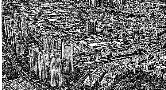
המית פרויקט פיניו בינוי במחצית הרב לניינסבאום. מגדלים של 40 קומות

התכנית שיהפכו את חנוך יוספטל למחצית הפנימי בינוי הגדול בישראל